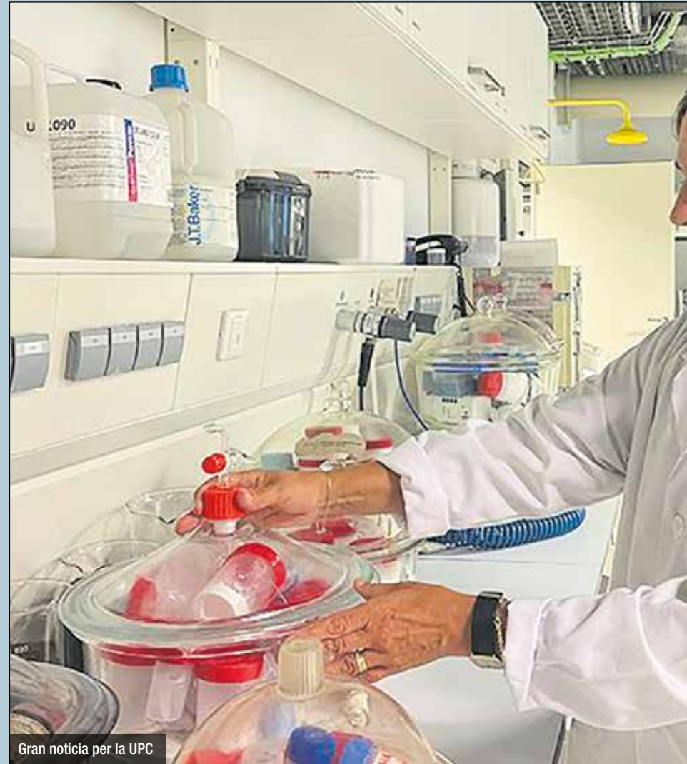
Gran notícia per la UPC

–“3D-Printing of high-resolution flexible bone grafts”, del grup Biomaterials, Biomecànica i Enginyeria de Teixits (BBT). Busca