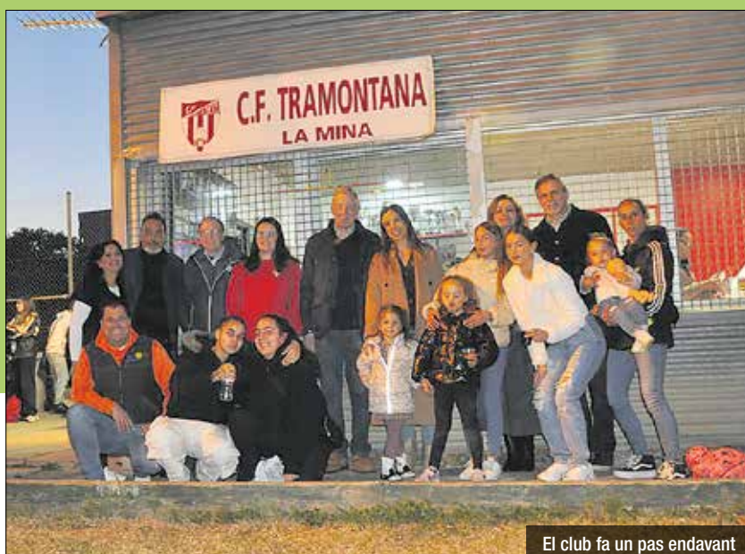
El club fa un pas endavant

d'un any i mig des de la seva creació, el setembre de 2023, juga a les categories aleví, infantil i amateur, i que la temporada vinent presentarà per primer cop l'equip cadet. Tot plegat fa un total de dotze equips que cada setmana defensen els colors del Tramuntana als partits de la Lliga catalana. El Club va ser fundat l'any 2000 i els seus inicis no van ser fàcils, gràcies a la perseverança i la determinació, actualment, és una entitat esportiva consolidada. Entre el seu palmarès, a part dels trofeus esportius com a campions de lliga de l'equip aleví els anys 2023 i 2024 -guanyant al Barça-, i el de subcampions de l'infantil l'any passat; el Tramuntana ha rebut el premi al Valor atorgat pel diari esportiu Mundo Deportivo i el premi de la Federació Catalana de Futbol al Millor Projecte (2023-2024), per la seva contribució al futbol com a motor de transformació social, especialment, pel seu compromís amb la inclusió i la igualtat de gènere. Sens dubte una gran notícia per l'entitat i Sant Adrià.