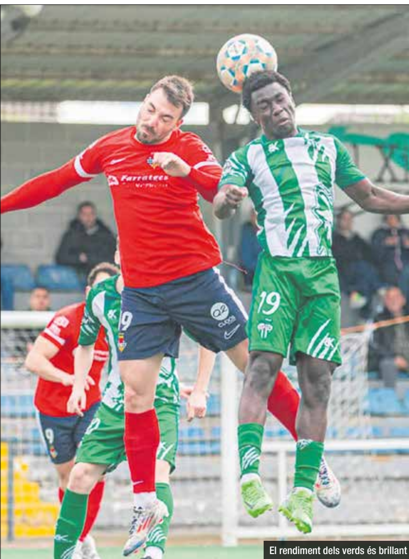
El rendiment dels verds és brillant

l'àrea rival però no seria capaç de xutar entre els 3 pals. La sensació de perill existia sobre la gespa del