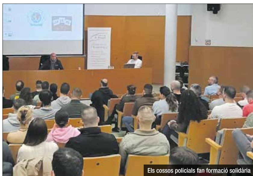
Els cossos policials fan formació solidària

responsabilitat col·lectiva i no només individual. Aquest servei contribueix al benestar de les famílies i, especialment, de les dones.