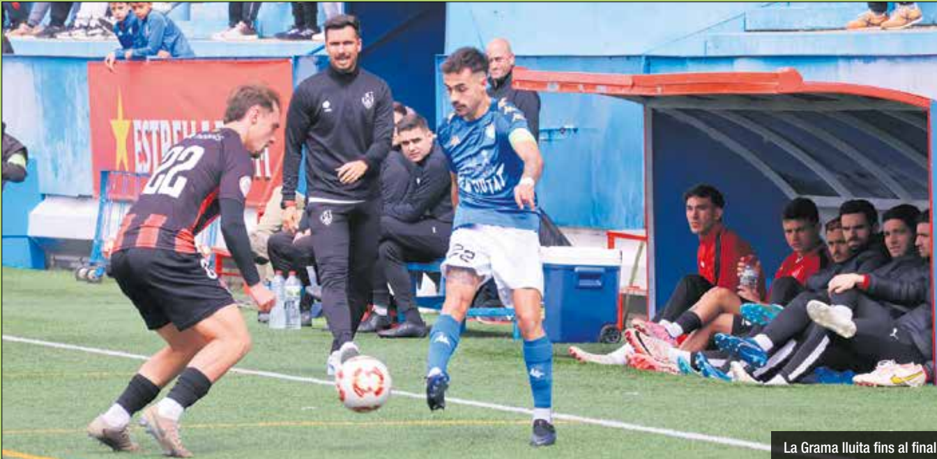
La Grama lluita fins al final

Els blaus veuen tallada la seva ratxa de 9 partits sense conèixer la derrota