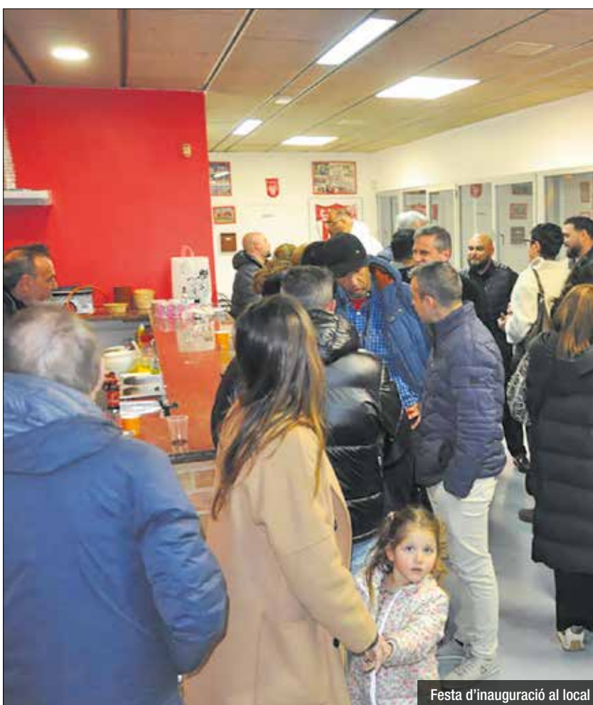
Festa d'inauguració al local