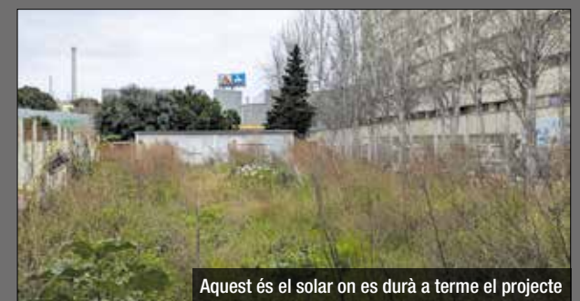
Aquest és el solar on es durà a terme el projecte

TEXT: DESDELAMINA.NET. La creació de l'hort comunitari al barri de La Mina és una iniciativa impulsada pel projecte Green for Good de la Fundació Ferrer i l'Ajuntament de Sant Adrià de Besòs. Aquesta proposta té com a objectiu recuperar aquest espai en desús i transformar-lo en un punt de trobada verd, sostenible i comunitari. Durant les darreres setmanes s'ha celebrat una jornada comunitària per poder treballar en torn als interessos i necessitats del barri, la qual