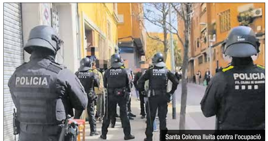
Santa Coloma lluita contra l'ocupació

en el dispositiu de desallotjament també hi han participat professionals dels Serveis Socials, que han ofert als desallotjats diferents alternatives i recursos de suport. Així mateix, operaris del servei de neteja han dut a terme la retirada d'una gran quantitat de residus i estris acumulats a l'interior de l'habitatge, omplint finalment dos camions d'escombraries. La Policia Local reitera el nostre compromís amb la seguretat i la convivència veïnal. Per aquest motiu, recordem que, si ets testimoni d'una ocupació o d'un fet delictiu, truca immediatament al 092.