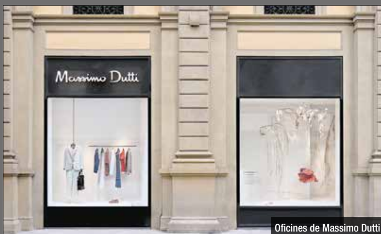
Oficines de Massimo Dutti

El grup Inditex traslladarà les oficines centrals de Massimo Dutti, Bershka, Oysho i Lefties, actualment ubicats a Tordera, a un nou campus que es construirà a Sant Adrià de Besòs. El campus inclourà activitats de disseny i desenvolupament de producte, patronatge, aparadorisme, gestió comercial, e-commerce i tecnologia, entre altres. Els edificis del nou campus tindran un disseny singular i s'integraran en l'entorn urbà. La instal·lació del grup Inditex a la ciutat