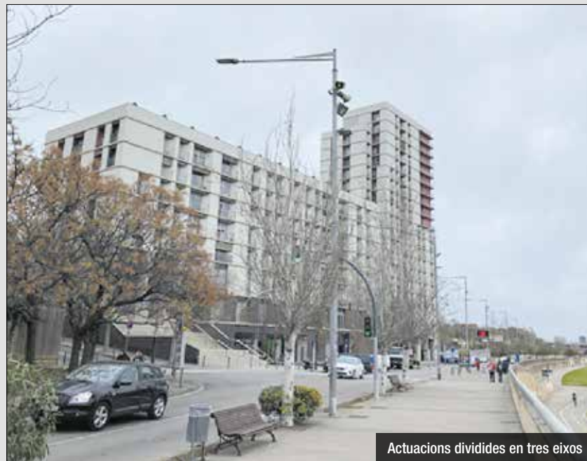
Actuacions dividides en tres eixos

El PAI del Raval té com a objectiu reduir la vulnerabilitat mitjançant la creació d'aquestes tres comunitats integrades (educadora, intergeneracional i innovadora), combinant les millores urbanes amb