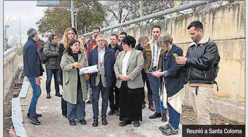
Reunió a Santa Coloma

del nou període d'obres, "a dia d'avui estem obrint una segona transformació del riu Besòs mitjançant tres fases de desenvolupament, totes elles relacionades amb la capacitat que podem tenir de recuperar la biodiversitat del nostre riu, de retornar-li al Besòs el que és del riu, en un acte de devolució i generositat cap a la natura que ens vindrà retornat de forma molt clara al llarg del temps". Per la seva banda, per al Secretari d'Estat, Hugo Morán, aquesta renaturalització "no només és recuperar el riu per millorar la qualitat de vida dels qui viuen al seu entorn i en poden gaudir, sinó que estem davant d'un projecte que ajuda la gent a entendre que un riu és una estructura que trasllada qualitat de vida i seguretat a la ciutadania". La fase 2 del Refugi de Biodiversitat compta amb el suport de la Fundación Biodiversidad del Ministerio para la Transición Ecológica y el Reto Demográfico (MITECO), en el marc del Pla de Recuperació, Transformació i Resiliència, finançat pels NextGenerationEU.