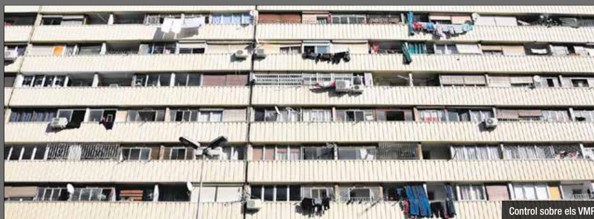
Control sobre els VMP