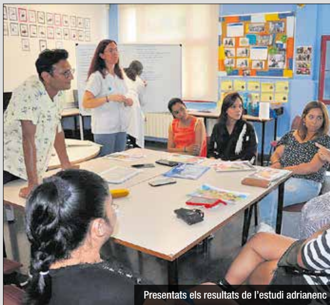
Presentats els resultats de l'estudi adrianenc

Una delegació del CAP La Mina presenta, al 21è Congrés d'Actualització de Pediatria, els resultats d'un estudi realitzat amb la participació de les famílies del barri per identificar necessitats alimentàries en infants de 0 a 5