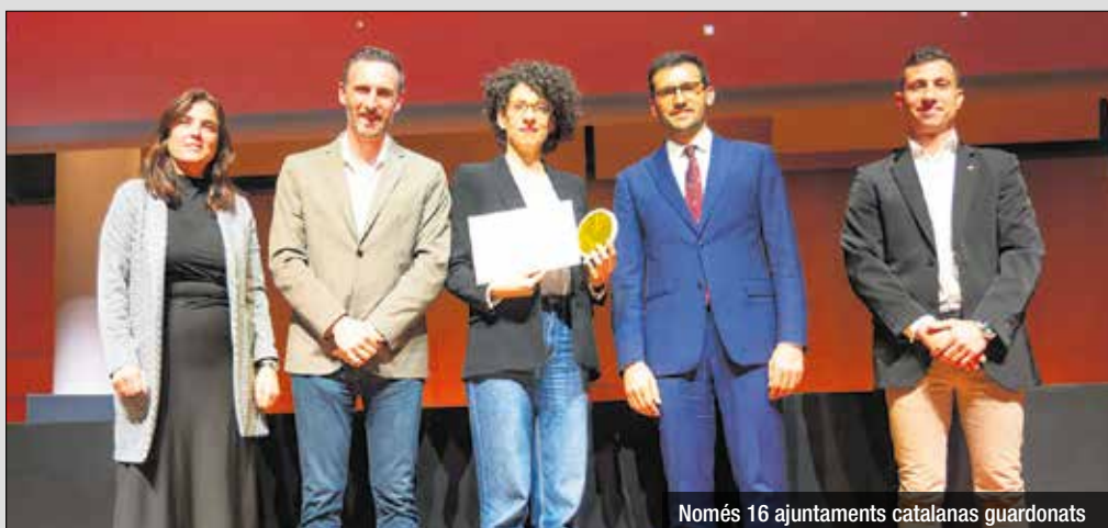
Només 16 ajuntaments catalans guardonats