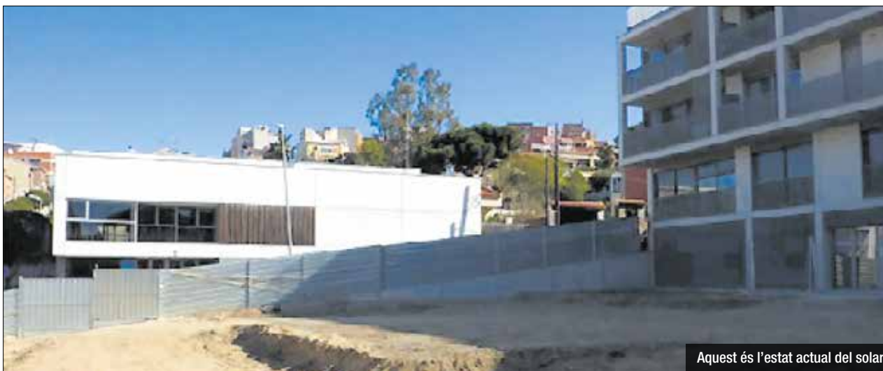
Aquest és l'estat actual del solar

La Junta de Govern Local ha adjudicat el projecte d'urbanització de la plaça situada a la cantonada dels carrers Washington i Cristòfor Colom, un espai de nova creació ubicat al barri de Riera Alta, amb un pressupost de 378.741 € i una superfície d'actuació de 1.401,54 m 2 . El projecte se situa l'encreuament dels dos carrers, enfront del poliesportiu Joan del Moral, aprofitant la nova alineació d'un edifici de nova construcció, i consisteix a realitzar la urbanització de la plaça que enllaçarà amb el poliesportiu amb un pas de vianants. La proposta inclou la instal·lació de jocs infantils i vol incorporar el màxim espai verd, amb nous parterres enjardinats i arbres.