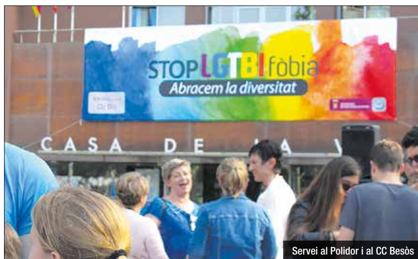
Servei al Polidor i al CC Besòs

Els agents participants han destacat la importància d'aquest tipus d'esdeveniments, no només per la seva vessant formativa en seguretat, sinó també per la seva contribució a una causa solidària de gran impacte social.