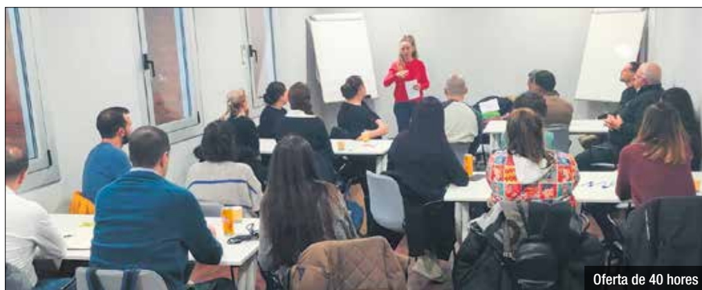
Oferta de 40 hores

Amb una sessió sobre la intel·ligència artificial i com pot afectar aquesta nova tecnologia als negocis, s'enceta la nova programació d'accions formatives en el marc del programa Consolida't. L'oferta de 40 hores de formació que impartirà Santa Coloma (recordem que el programa es realitza juntament amb l'Ajuntament de Badalona) contempla sessions introductòries a àmbits com: intel·ligència artificial i màrqueting, fiscalitat de l'autònom/a, com establir el preu de productes o serveis, facturació electrònica o aspectes legals i comptables de les persones autònomes. S'han pro-