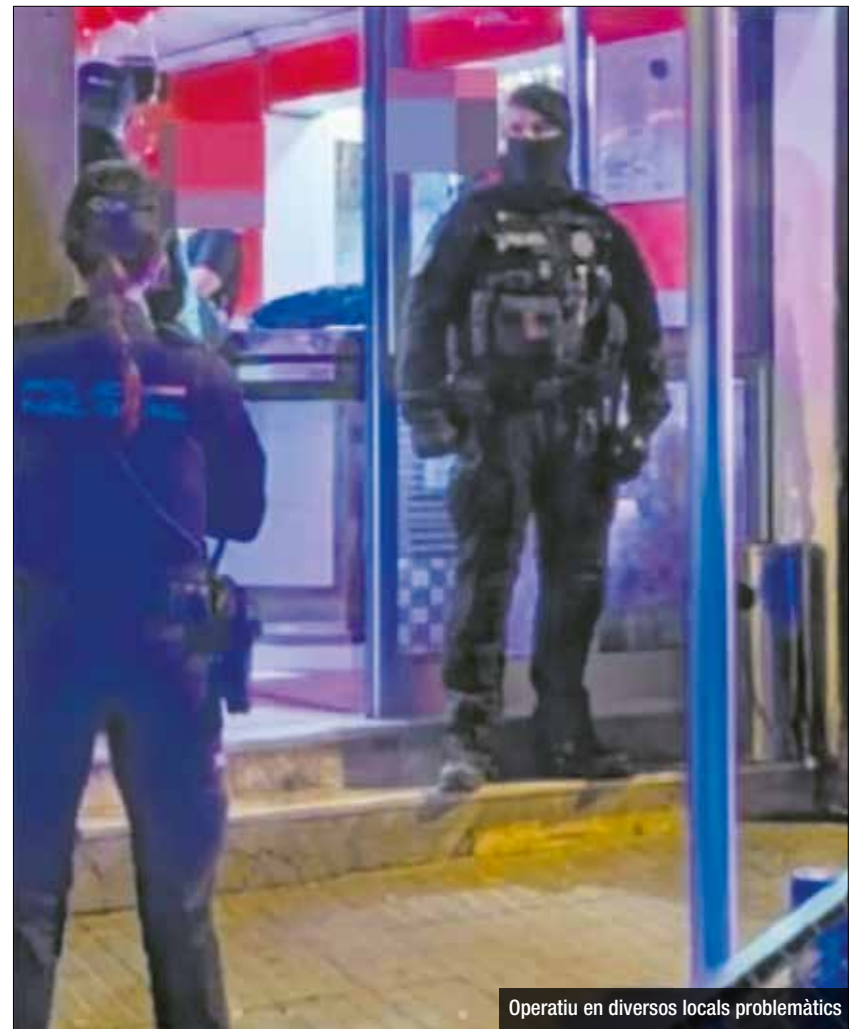
Operatiu en diversos locals problemàtics

Aquest operatiu s'emmarca dins el pla de seguretat preventiva i de control d'activitats il·lícites en espais d'oci i establiments comercials, amb l'objectiu de preservar la seguretat i la convivència.