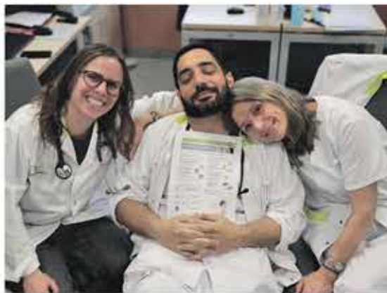
Professionals de la FHES amb el full informatiu de bons hàbits del son

Durant la jornada, el grup va recórrer diferents espais de l'hospital per compartir consells i recomanacions destinats a millorar la qualitat del son. L'objectiu d'aquesta acció era conscienciar sobre el paper essencial que té el descans en la salut física i mental, destacant-ne els beneficis i promovent hàbits que ajudin a aconseguir un son reparador.