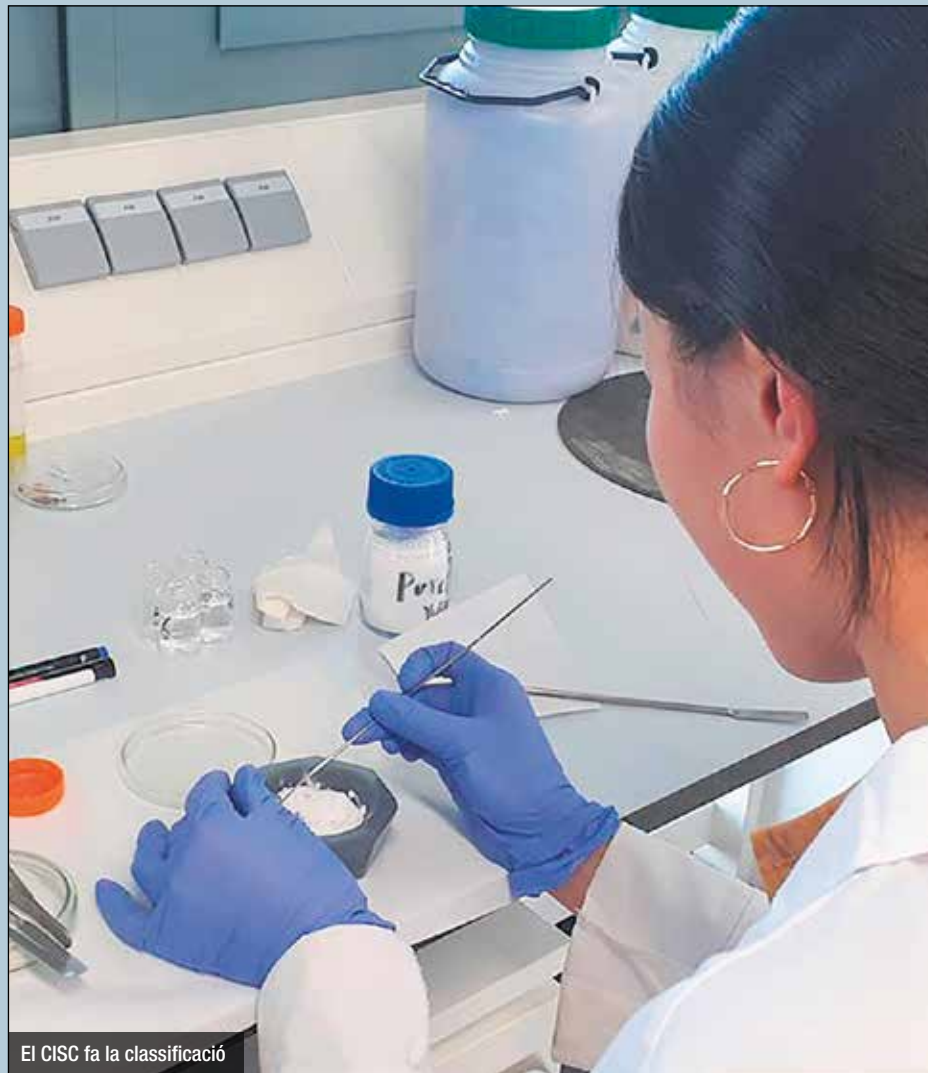
El CISC fa la classificació