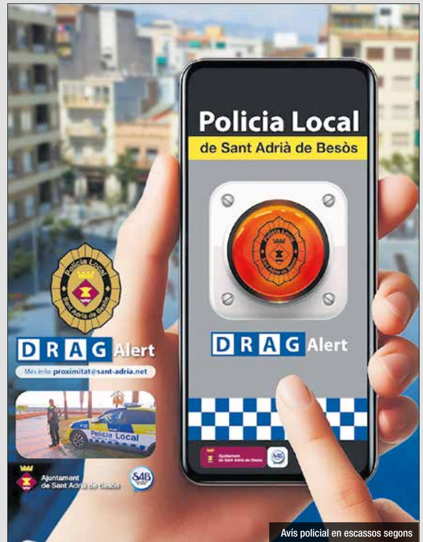
Avis policial en escassos segons

sistema d'alarmes (entitats bancàries, joieries o similars). Cada persona que treballi a l'establiment pot activar el servei gratuïtament, però un mateix telèfon no pot tenir associat més d'un comerç o local, és a dir ha d'estar vinculat a una única adreça. Per activar el servei només cal descarregar-se l'aplicació amb un codi que facilitarà la policia local, a continuació es generarà una sol·licitud d'adhesió al DragAlert. Posteriorment la policia s'aproparà a l'establiment per explicar el funcionament i les condicions d'ús del servei i per enllestir la instal·lació. També verificarà que la cobertura telefònica sigui adequada per garantir la connexió del DragAlert. DragAlert és un sistema d'avis de la policia més eficaç que vol millorar el servei a la ciutadania.